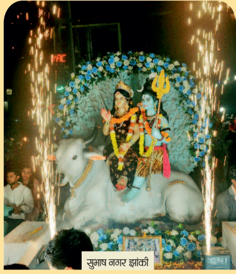
सुभाष नगर झांकी