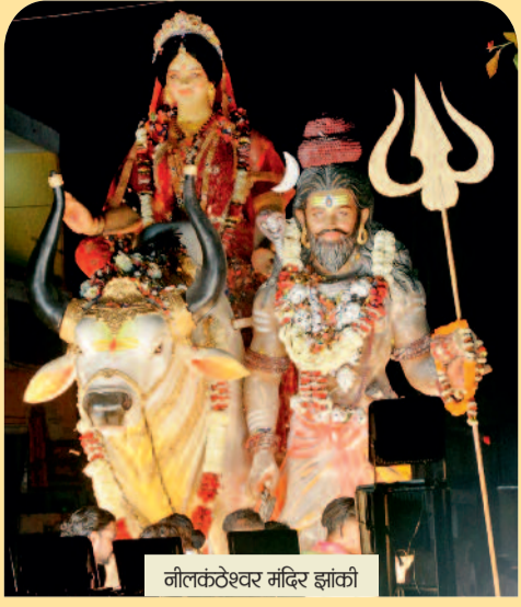
नीलकण्ठेश्वर मंदिर झांकी