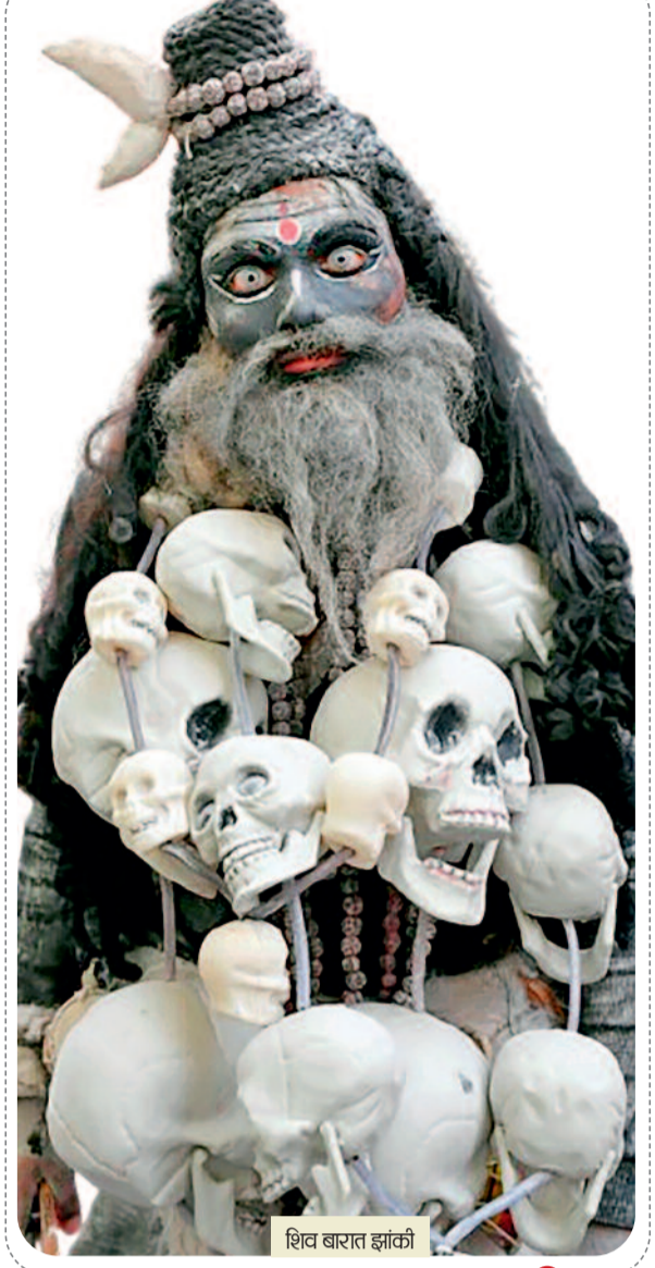
शिव बारात झांकी