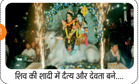
शिव की शादी में दैत्य और देवता बने...