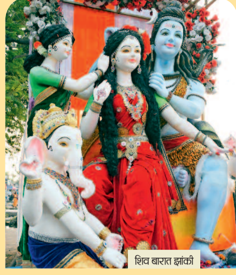
शिव बारात झांकी